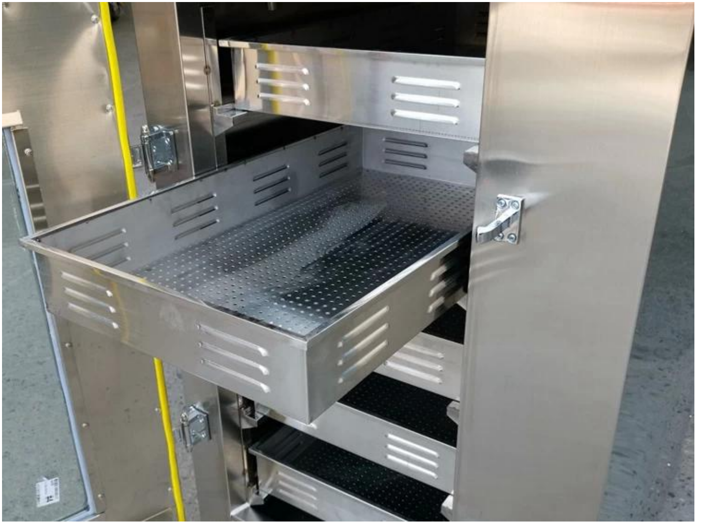
Tangki dan dulang dalam direka dengan keluli tahan karat, yang bersih dan bersih.