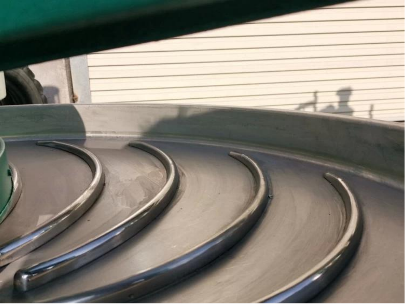
Reka bentuk tong laras yang tinggi dapat mengelakkan daun teh jatuh.