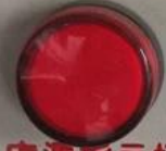
电源指示灯 Power LED