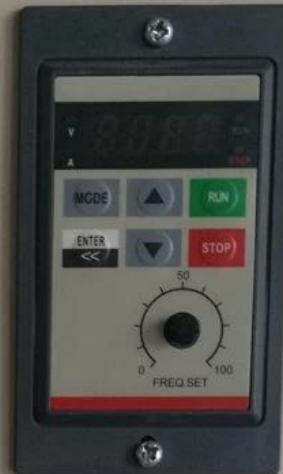
调速器 Speed Control