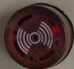
报警器 Alarm LED