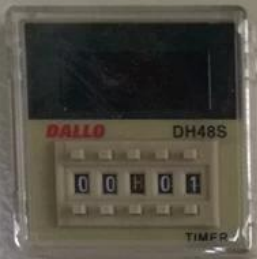
计时器 Time Control